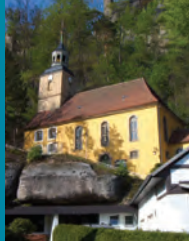
Die Bergkirche Oybin