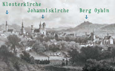
Zittau um 1850