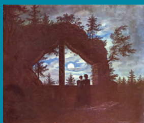
Carl Gustav Carus Fenster am Oybin im Mondschein , 1828